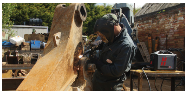
údržba a opravy,