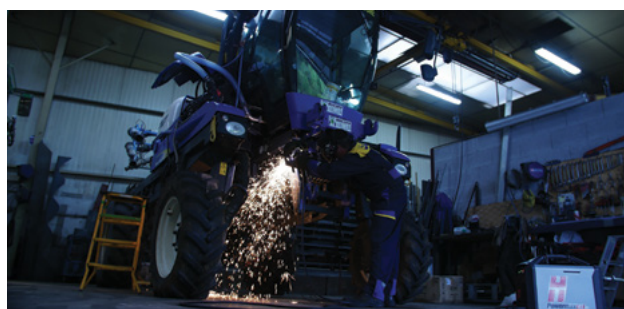
zemědělství a údržba zemědělské techniky.